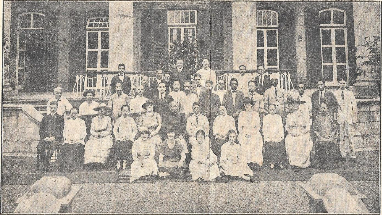
GROUP AT A SATURN LODGE MEETING (LATER, SHANGHAI & SUN LODGES)